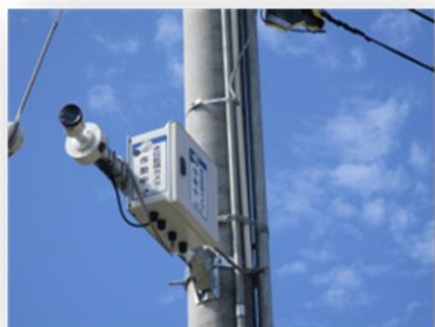
ネットワークカメラ (SIM型)