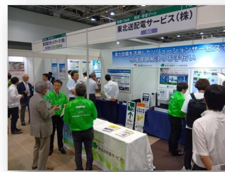
＜参考写真＞ 第6回 地域×Tech東北 出展時の様子（2025年8月開催）