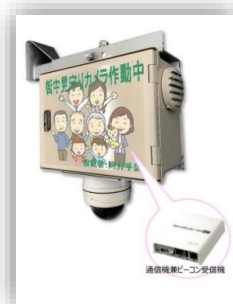
まちなか安心安全インフラ・ソリューション (参考出展)